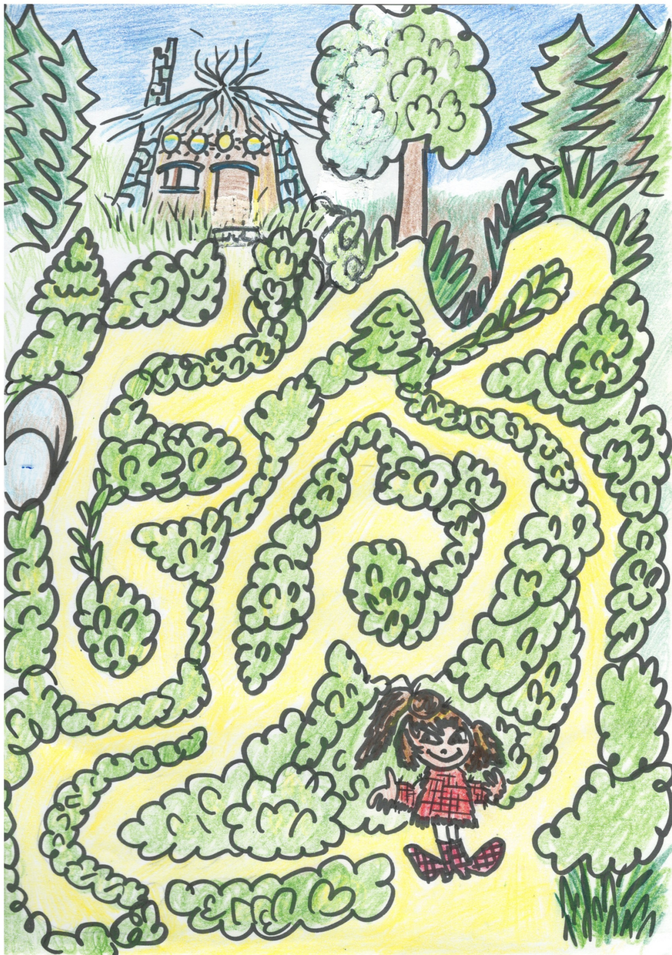
➤ Čarodějnický rituál